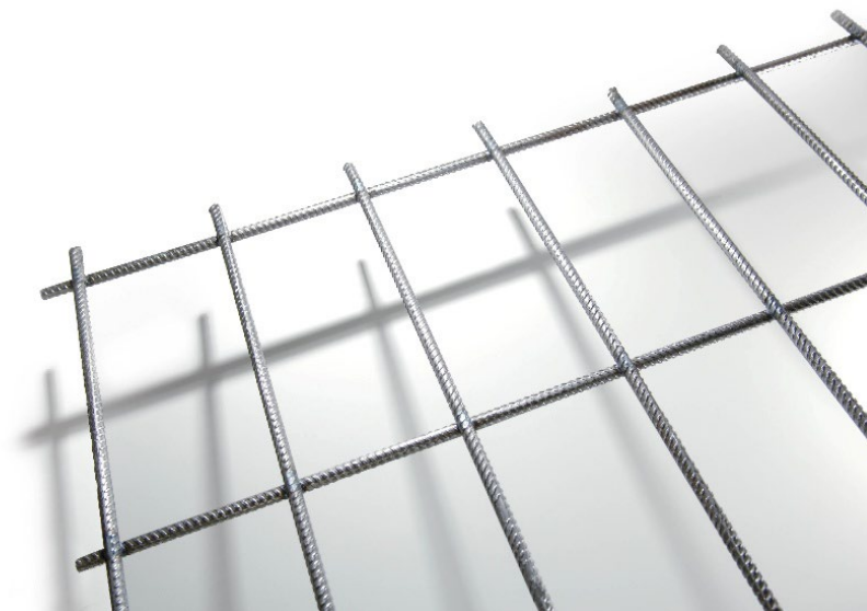
Kuva 2. Havainnollistava kuva tutkittavista tuotteista