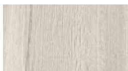
Art.-No.: 337955 EHD027 Elva tammi valkoinen 7.5/33 Classic