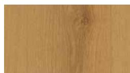
Art.-No.: 338280 EHD004 Tammi velvet 7.5/33 Classic