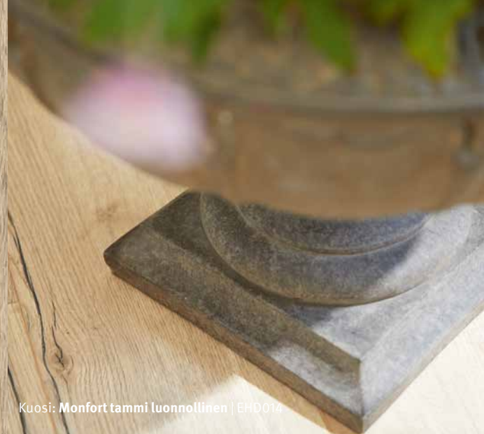
Kuosi: Monfort tammi luonnollinen | EHD014

Luonnollisesti hyvinvointia tukeva lattiämme on tehty vedenkestävä ja pitävä jalan alla. Ihanteellinen siis keittiöihin ja eteisiin tai miksipä ei koko asuntosi lattiaksi. uusiutuviesta raaka-aineista, puu on peräisin kestävästä metsätaloudesta ja alusta kierrätettyä korkkia.