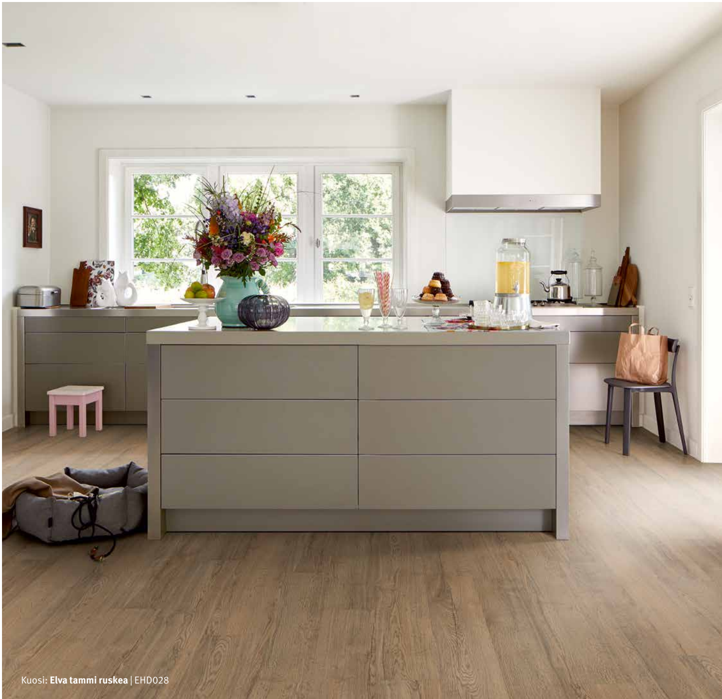
Kuosi: Elva tammi ruskea | EHD028