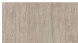
Art.-No.: 338082 EHD024 Calora tammi harmaa 7.5/33 Classic