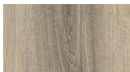
Art.-No.: 338341 EHD002 Tammi karkea harmaa 7.5/33 Classic