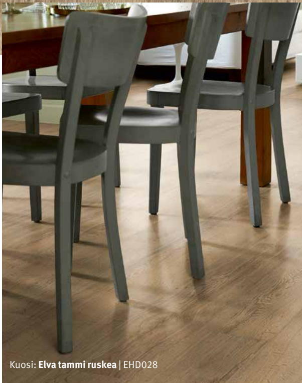
Kuosi: Elva tammi ruskea | EHD028