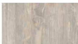
Art.-No.: 338150 EHD020 Zappulla mänty vaalea 7.5/33 Classic

EGGER HOME Design -lattia toimii kaikkialla. Valitse vain jokaista huonetta varten tyyliäsi parhaiten sopiva kuosi.