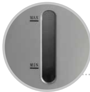
OBLÒ CONTROLLO LIVELLO ACQUA WATER LEVEL WINDOW