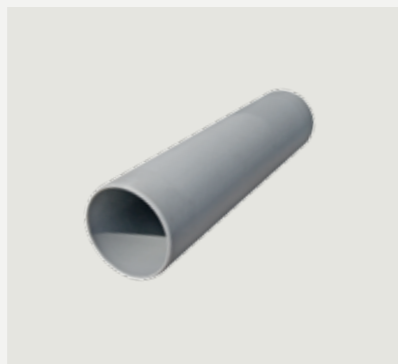
Anslutningsrör frånluft 45 cm