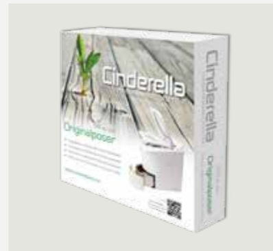
500 st papperspåsar