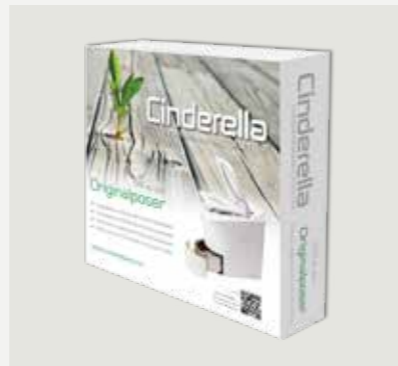
500 st papperspåsar