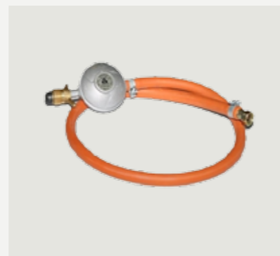
Gasslang och regulator