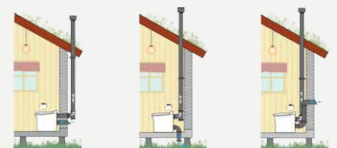
Installation av Cinderella Comfort