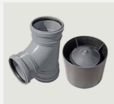
T-rör och regnhatt