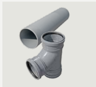
Anslutningsrör frånluft 45 cm och T-rör