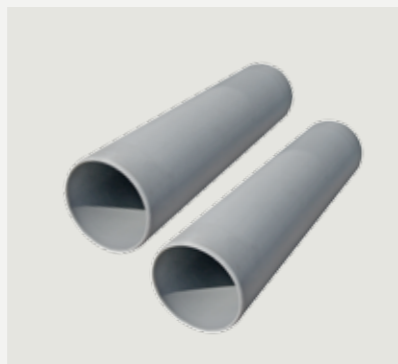
Anslutningsrör till- och frånluft 45 cm