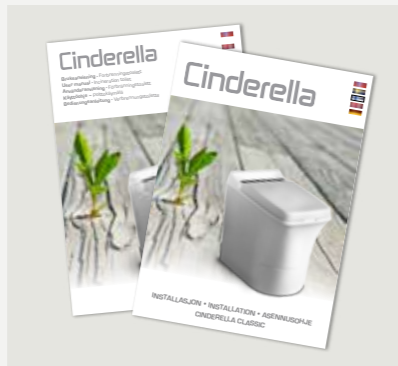
Installations- och användaranvisning