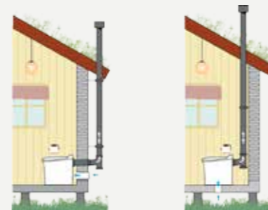
Installation av Cinderella Classic och Gas