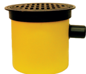
HERO 40 LK