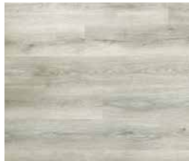
Dusty Grey DOU-603-IB