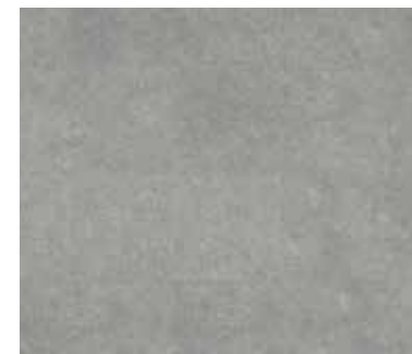
Harbor Grey DOU T-614-IB