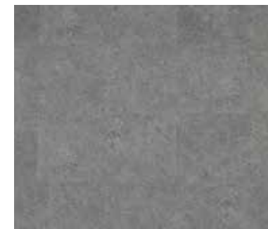
Tropical Storm DOU T-615-IB