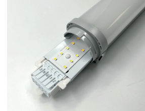
InduProof on tarvittaessa helposti korjattavissa.