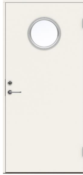
Dörr med runt glas 10x21 u-värde 0,8