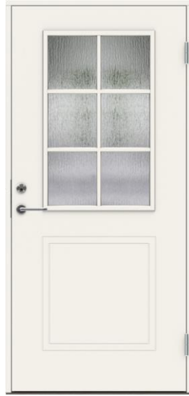
Dörr med 6 glas 10x21 9x21 u-värde 1,1