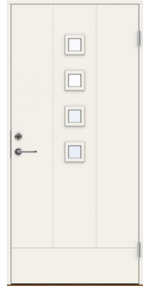
Dörr med 4 glas 10x21 9x21 u-värde 0,8