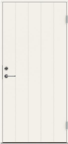
Tät dörr 10x21 u-värde 0,8